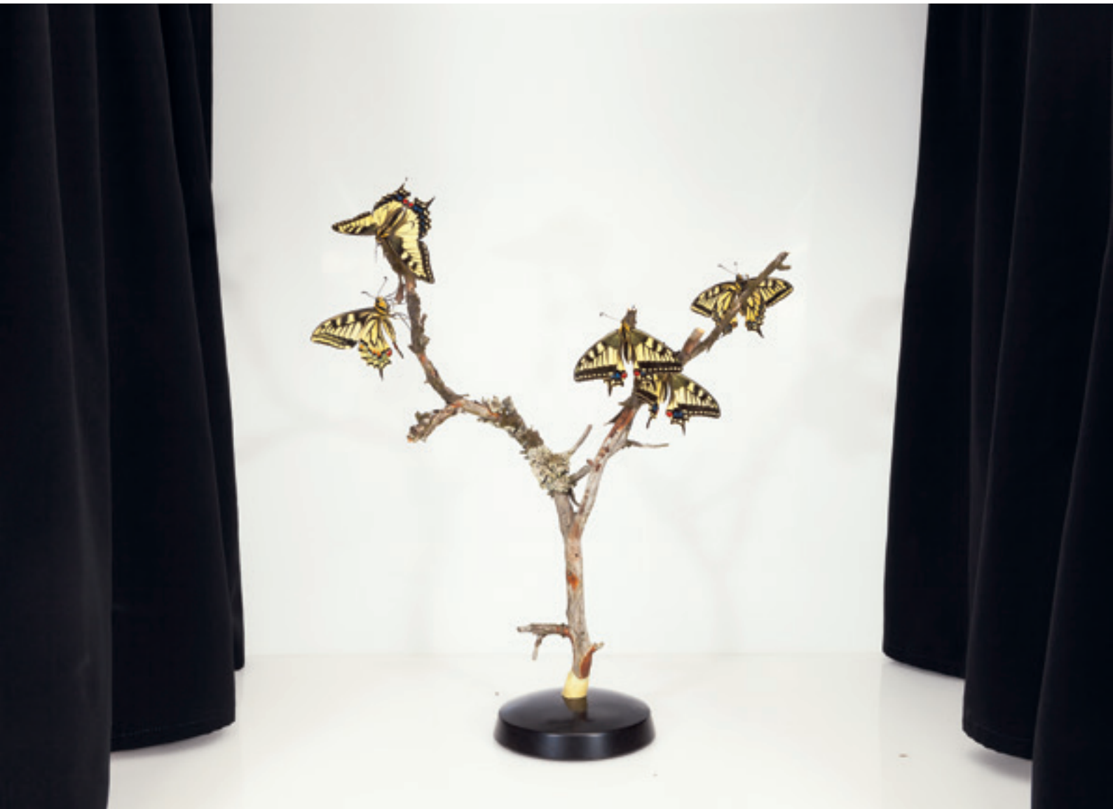
SANNA KANNISTO Papilio machaon (Ritariperhonen) , 2016 pigmenttituloste, 65 × 92 cm yksityiskokoelma